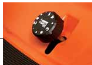
Regolazione altezza di taglio centralizzata