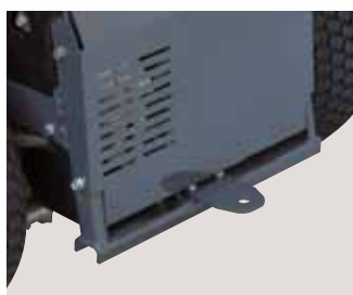
Gancio di traino